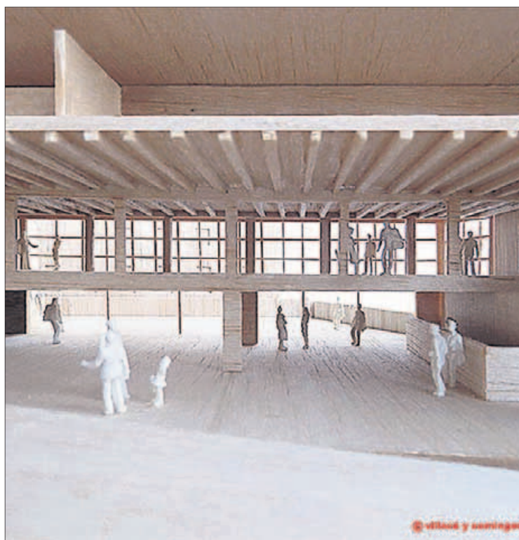
Recreación de la futura zona de ocio y hostelería del pazo.

responsables de GBS comentan que, en un principio, se proyecta destinarlas a empresas y crear un “centro financiero”. La idea sin em-