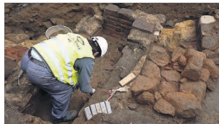
Trabajos en los vestigios arqueológicos del solar.

Los vestigios que se desenterraron en el solar del pazo se han trasladado ahora al Museo Quiñones de León, donde también se guardan otras piezas fundamentales de la historia de la ciudad.